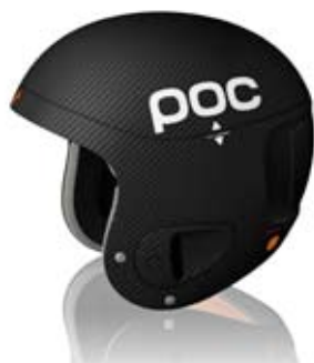
SUPER SKULL COMP