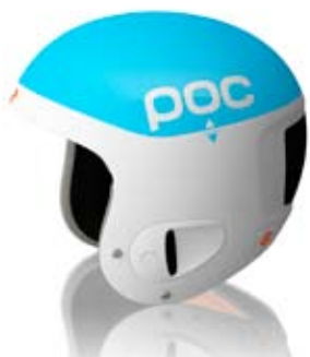
SKULL COMP JULIA