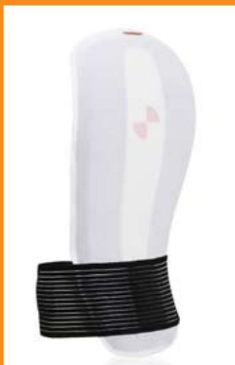
SPINE VPD FIS