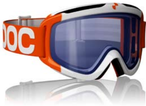
IRIS COMP RACE STUFF