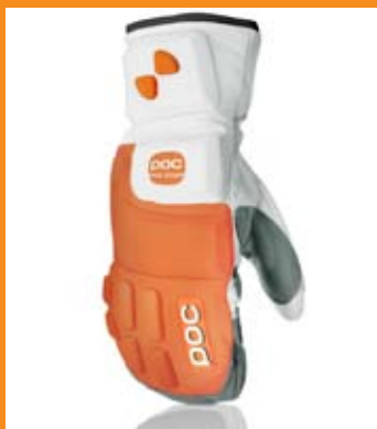
PALM RACING MITTENS